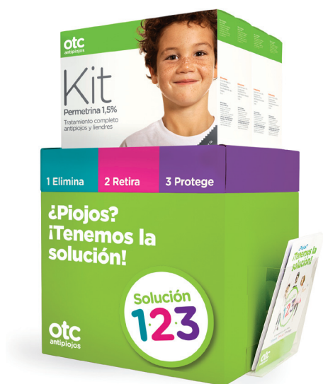
Expositor 21,5 x 23 cm

Los expositores, totems y otros elementos ayudan a entender con claridad el problema de los piojos y presentan su solución más fácil y eficaz.